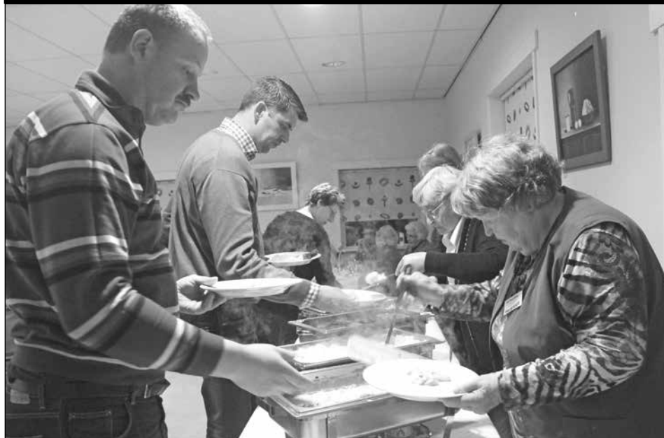
Gasten krijgen hun warme maaltijd opgescheppt door vrijwilligsters van 'Ons Eetcafé' Leersum-Amerongen.