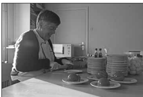
Het bereiden van de maaltijden.