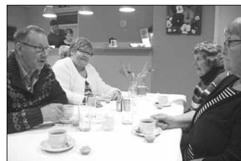
Geanimeerd aan tafel.