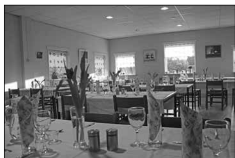
Fraai gedekte tafels.